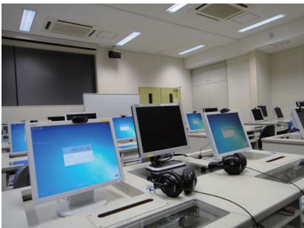
CCD カメラとヘッドセットマイクロフォン